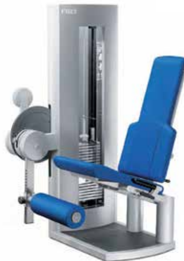
Alle Geräteabbildungen entsprechen nicht der Optik mit FREI GUIDE System.

AUCH ALS KOMBIGERÄT KNIEBEUGER / KNIESTRECKER ERHÄLTICH