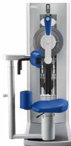
Alle Geräteabbildungen entsprechen nicht der Optik mit FREI GUIDE System.